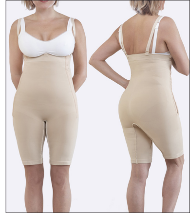
Hakaskiinnitys kummassakin kyljessä ja irrotettavat olkaimet.