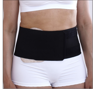
ViraRak 15 cm, 50230