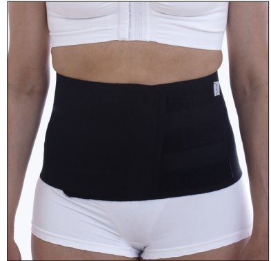
ViraRak 20 cm, 50231