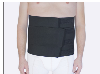
ViraKing - ainoastaan musta, koko 2-3XL.