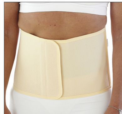
50212: 20 cm