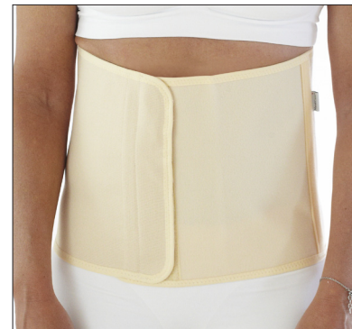
50210: 25 cm