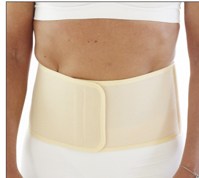
50211: 16 cm