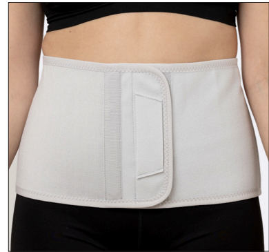
50212: 20 cm