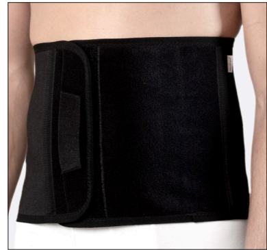
50210: 25 cm