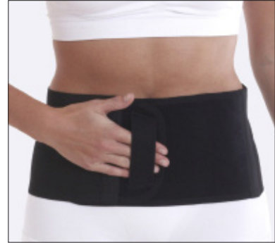
50211: 16 cm