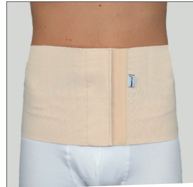
50204: 25 cm