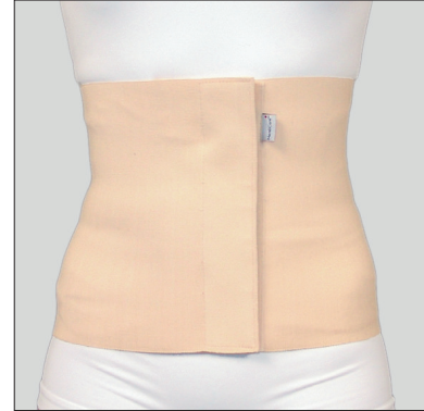
50205: 30 cm